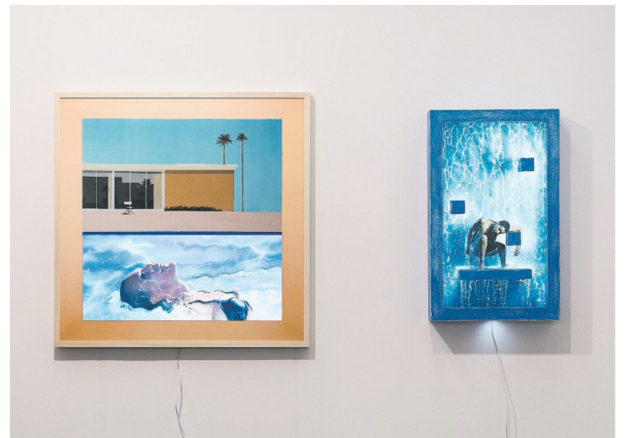
Animierter Pool à la David Hockney bei der Galerie Marthaler aus Montreux.

den rigiden Standbereich ergänzen und auflockern sollen.